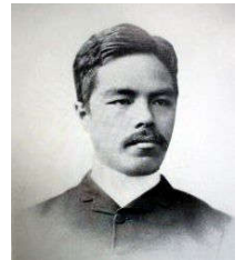
若き日の内村鑑三 人気絶大。