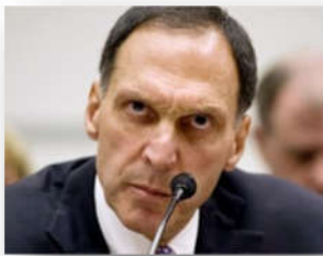
リチャード・ファルド CEO