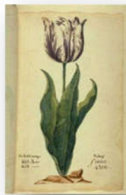
センペール・アウグスト